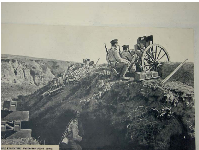
Пулемёт Максима в бою.