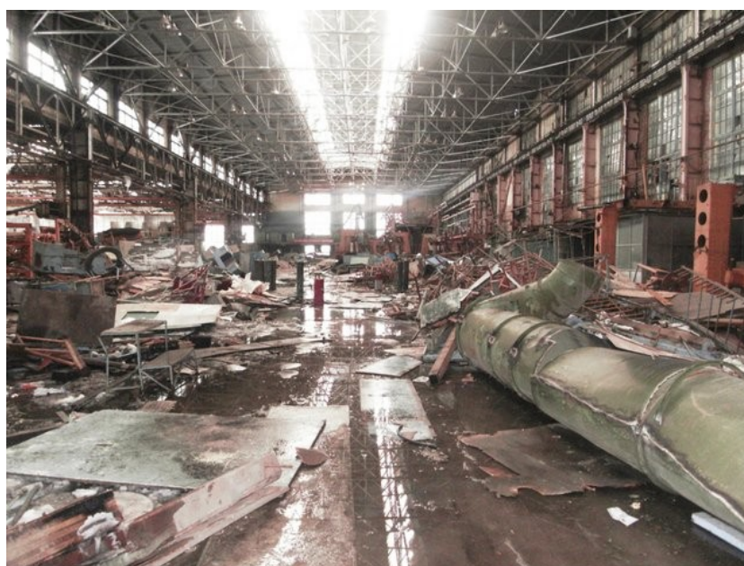
Так в настоящее время выглядят цеха завода, которые ещё недавно производили самолёты «Ту».